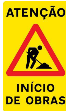
Sinal de trânsito provisório, perigo, início obras