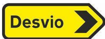
TV4 – DESVIO DIREITA