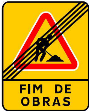
ST14 – FIM DE OBRAS