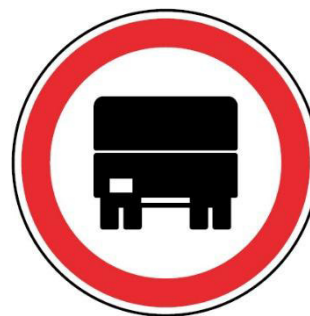
C3b – TRÂNSITO PROIBIDO A VEÍCULOS PESADOS