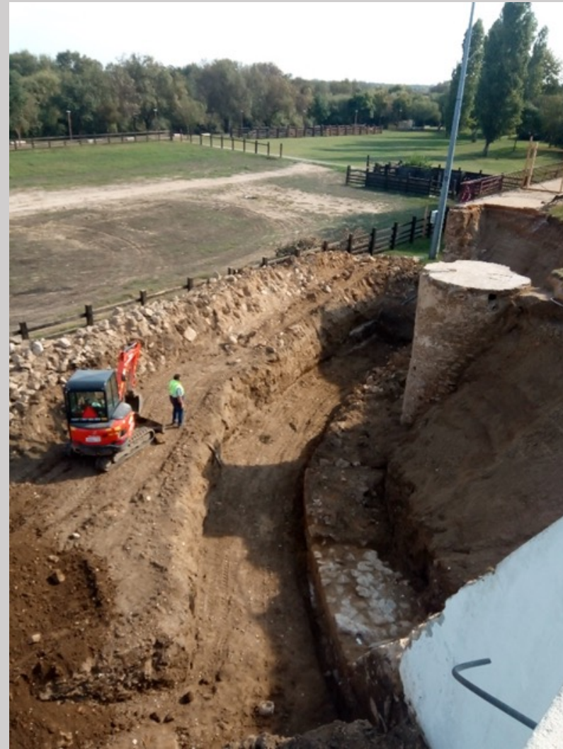
Descoberta de elemento arqueológico – Poço de moinho de vento

Durante os trabalhos de escavação, acompanhados por um arqueólogo, foi detetada uma estrutura, que após análise, foi possível identificar como o poço do moinho de vento que existiu no local. Este elemento, é de interesse que seja visitável. Desse modo, está em elaboração um projeto de arranjo exterior de integração.