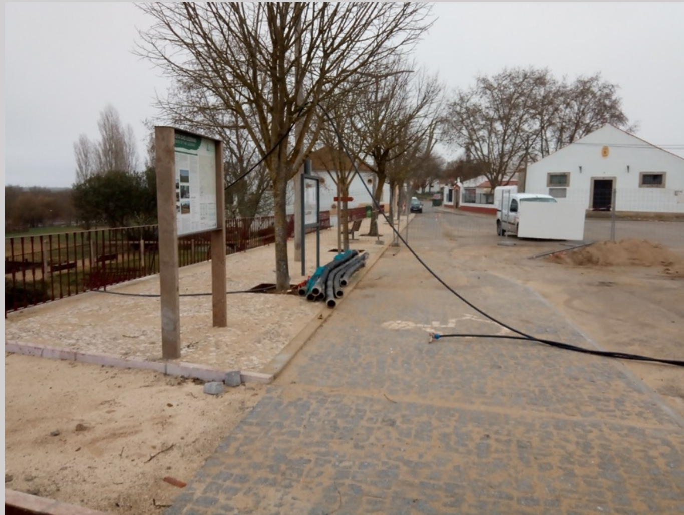
Repavimentação de passeio e definição dos lugares de estacionamento em calçada de granito

REQUALIFICAÇÃO E REABILITAÇÃO DO CRUZEIRO DO CALVÁRIO Benavente