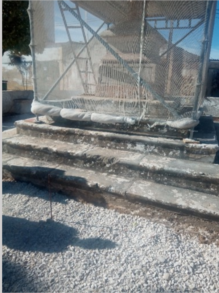
Antes da limpeza e tratamento