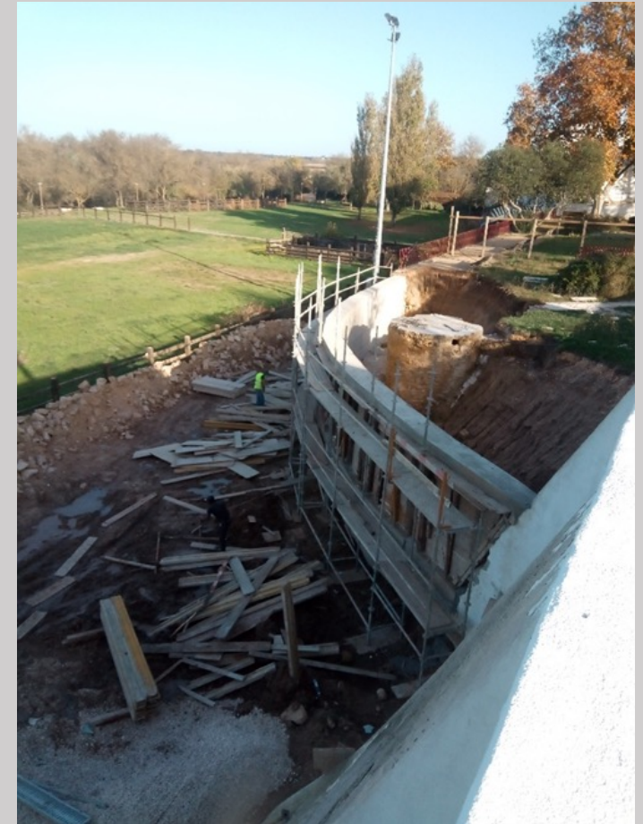
Execução de muro de suporte do jardim

REQUALIFICAÇÃO E REABILITAÇÃO DO CRUZEIRO DO CALVÁRIO Benavente