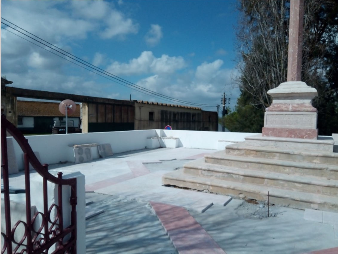
Enobrecimento do pavimento do adro do cruzeiro em pedra de Lioz