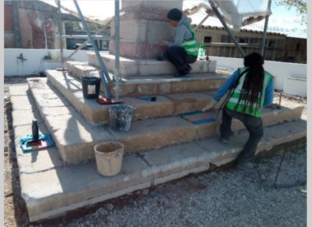
Durante a limpeza e tratamento

REQUALIFICAÇÃO E REABILITAÇÃO DO CRUZEIRO DO CALVÁRIO Benavente