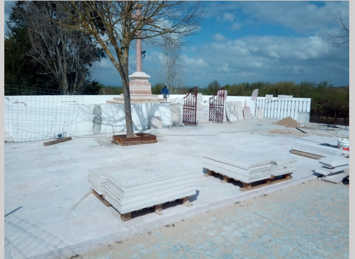
Pavimento envolvente ao adro do cruzeiro em pedra Lioz

REQUALIFICAÇÃO E REABILITAÇÃO DO CRUZEIRO DO CALVÁRIO Benavente