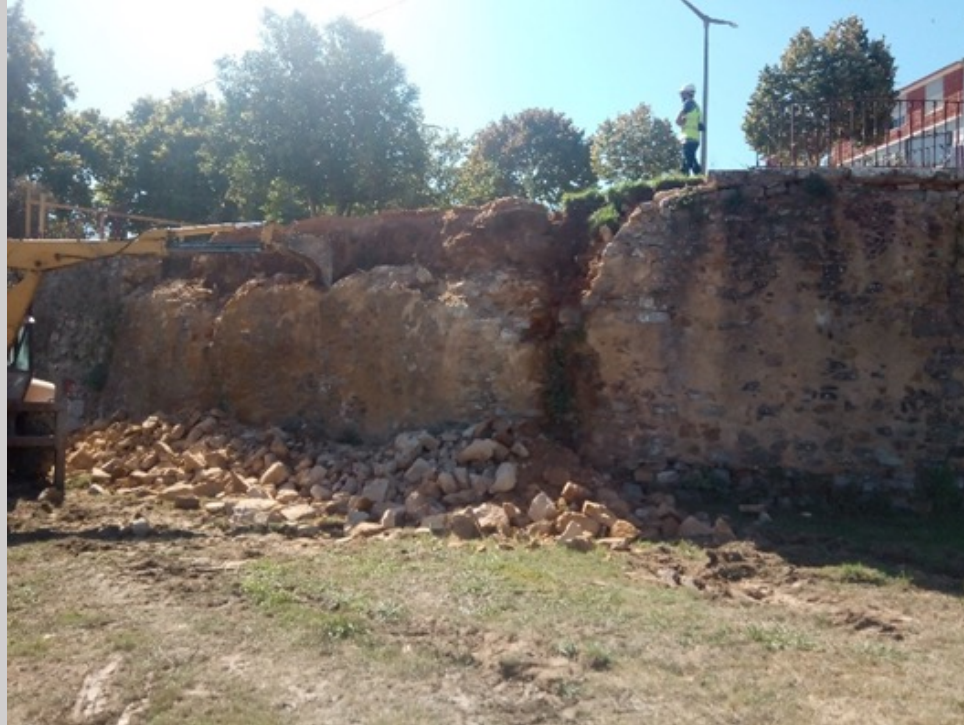
Demolição Muro de Suporte